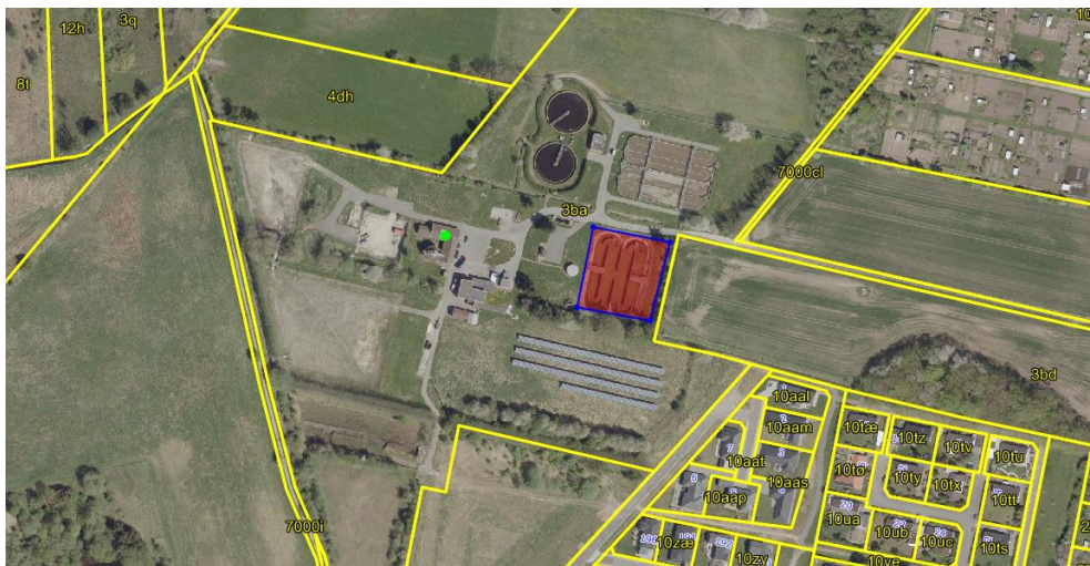
Kort 1 viser bassinets placering i området

Det ansøgte projekt omfatter et bassin på 5.200 m 3 og et forbassin med indløbet fra Søgrøften. De eksisterende bassin (ringkanaler) genbruges, men bassinet udvides mod øst, hvor der afgraves jord frem til Søgrøften til samme kote som eksisterende ringkanaler, som har en bundkote på 37,6. Kronekanten omkring bassinet vil blive omtrent kote 40, hvilket er ca. 20 cm højere end eksisterende ringkanaler. Bassinets udvidelse vil blive opbygget med skrå sider bestående af beton i både bund og på skråninger – således "efterlignes" udseendet på de eksisterende ringkanaler. Beplantningen omkring renseanlægget og bassinet vil blive bevaret.